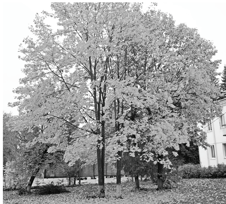
Золотой сентябрьский денек.

Люди заготавливают продукты к зиме, осенью много хлопот,